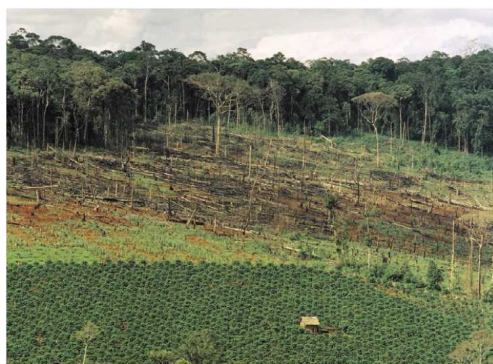
Document Un front pionnier au Vietnam pour la culture du manioc