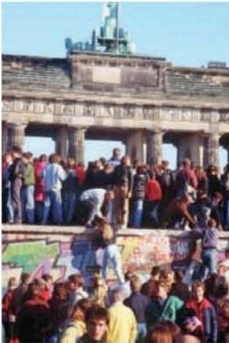
Doc. 1 Les changements intervenus dans le monde depuis les années 1990

1 « Le symbole de la bipolarisation du monde, le mur de Berlin, tombe en 1989. Deux ans plus tard, l'URSS disparaît. En Europe, la Russie n'est plus qu'une puissance moyenne et les anciens États communistes rejoignent l'Union européenne et l'OTAN. [...] »